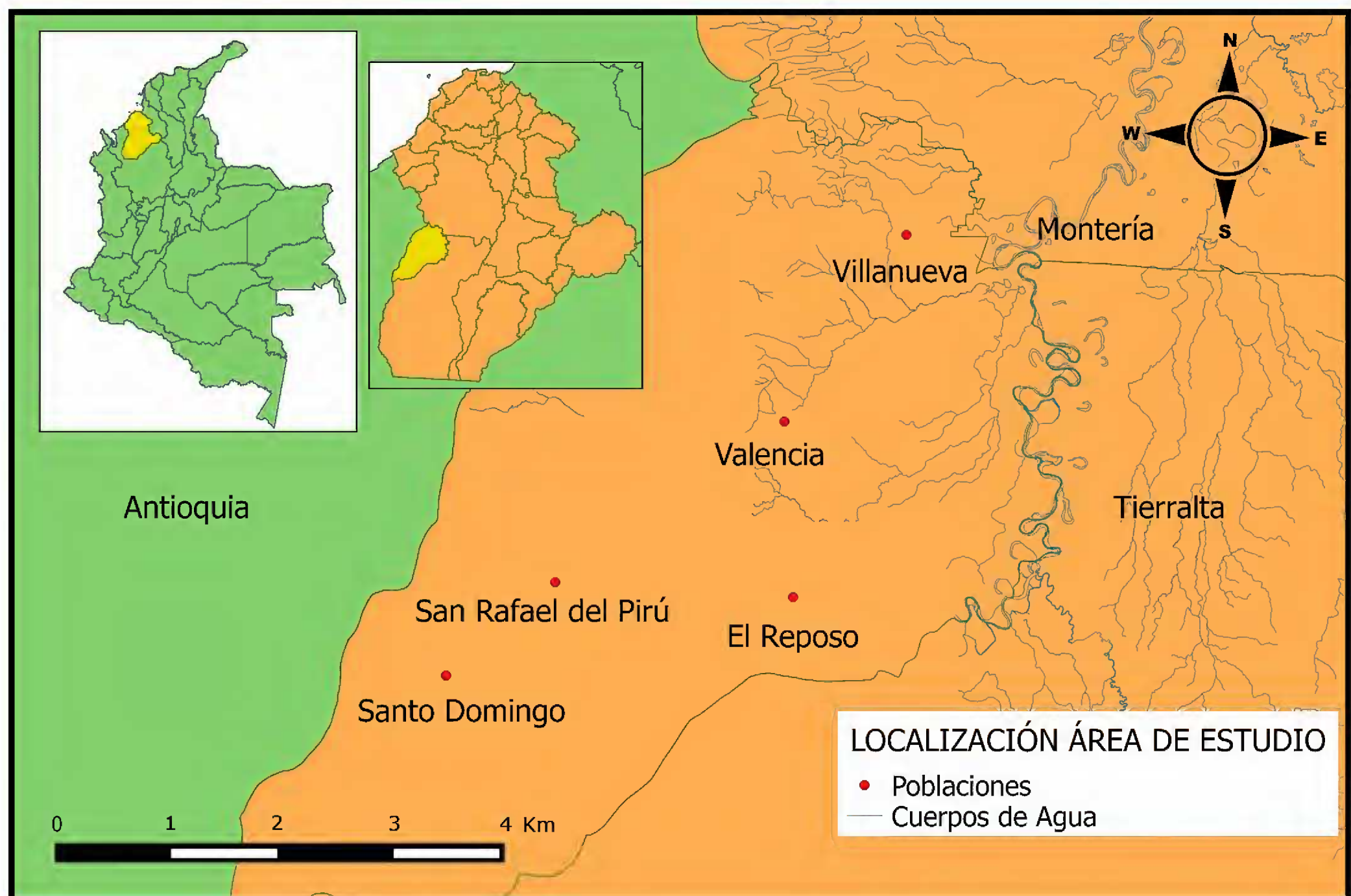
Figura 1: Mapa de ubicación del municipio Valencia, departamento de Córdoba, Colombia.

La extracción del ADN genómico se llevó a cabo en 40 mg del material macerado, usando el Dneasy Plant